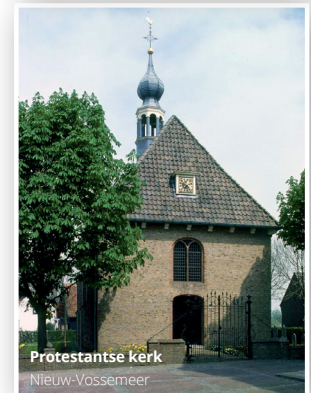
Protestantse Kerk Nieuw-Vossemeer

In dit boekje vindt u een overzicht van alle werkgroepen met een contactadres. Verdere medewerkers en adressen kunt u vinden op onze website: www.pghnv.nl